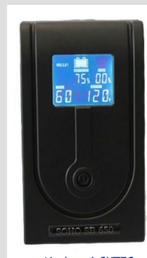
No-break SKTEC Soho SB 650-120