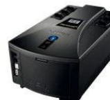
No-break Weg Personal 600, 700 e 1200 Line Interactive Monofásico