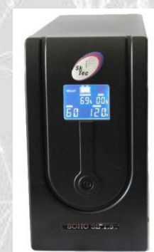
No-break SKTEC Soho SB 1500-120