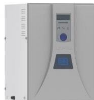
No-break Weg Garage Monofásico 1/3 CV