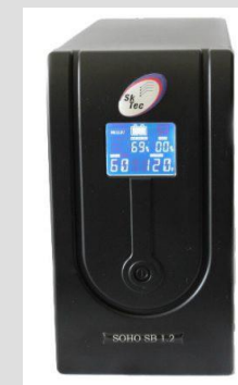
No-break SKTEC Soho SB 1200-120