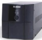
No-break TS Shara UPSGate Universal 2200 e 3200