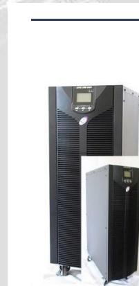
No-break Sktec Live Line 6000