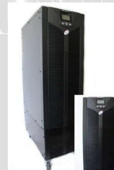
No-break Sktec Live Line 10000