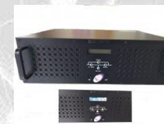
No-break Sktec SohoLine 3000-120 Rack