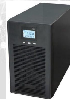
No-break SKTEC Soho Line 400n