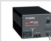
No-break TS Shara UPSGate Universal 1200 e 1600